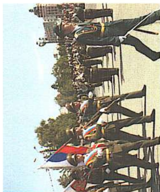
Боевое Знамя института

С кандидатами, зачисленными в институт курсантами, заключается контракт на время обучения и 5 лет военной службы после окончания. Каждый выпускник получает водительское удостоверение на право управления автомобилем категории «В» и «С», а курсанты, обучающиеся на специальностях бронетанкового направления, также удостоверяются механика-водителями гусеничной машины.