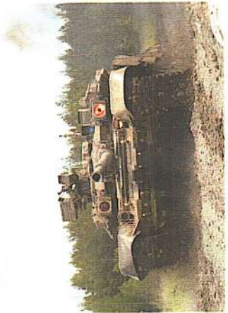
Занятие по вождению танков