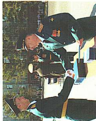
Выпуск молодых офицеров